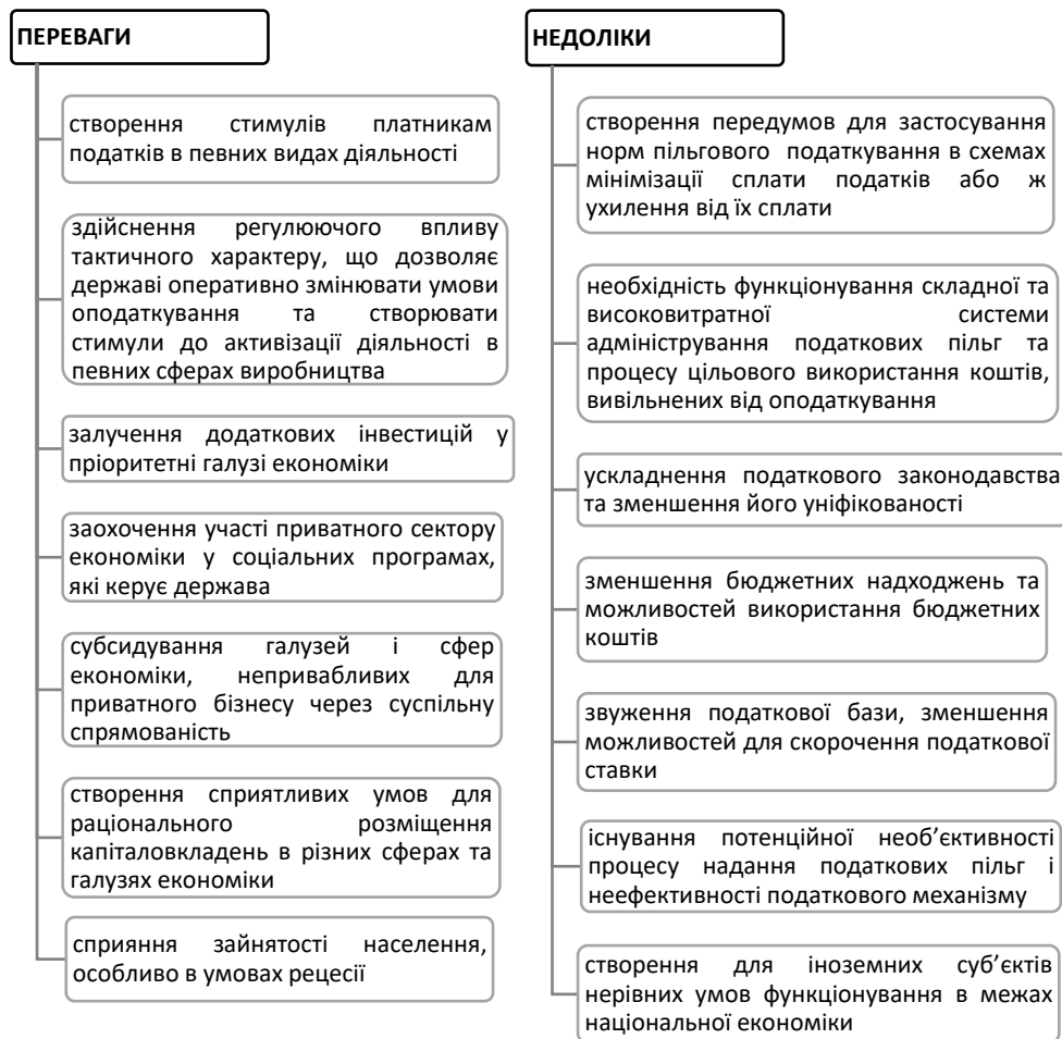
Рисунок 2 – Переваги та недоліки податкових пільг

надання зумовлює необхідність з'ясування переваг та недоліків (рис. 2).