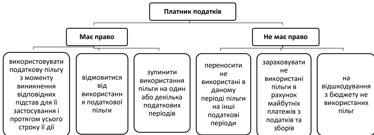
Рисунок 1 – Права платників податків стосовно використання податкових пільг

Використання податкових пільг – це не обов'язок платника, а його право.